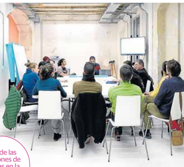
Una de las reuniones de artistas en la gestión de Carpa.

los últimos tiempos, gracias al surgimiento de nuevos artistas, recibidos con gran interés por el público. “En Aragón y en Huesca se está viendo. La Escuela de Circo Social y la Asociación de Malabaristas llevan mucho tiempo en Zaragoza. Somos casi veinte compañías profesionales. Hay un movimiento que está surgiendo y se está expandiendo”, afirma Ariño.