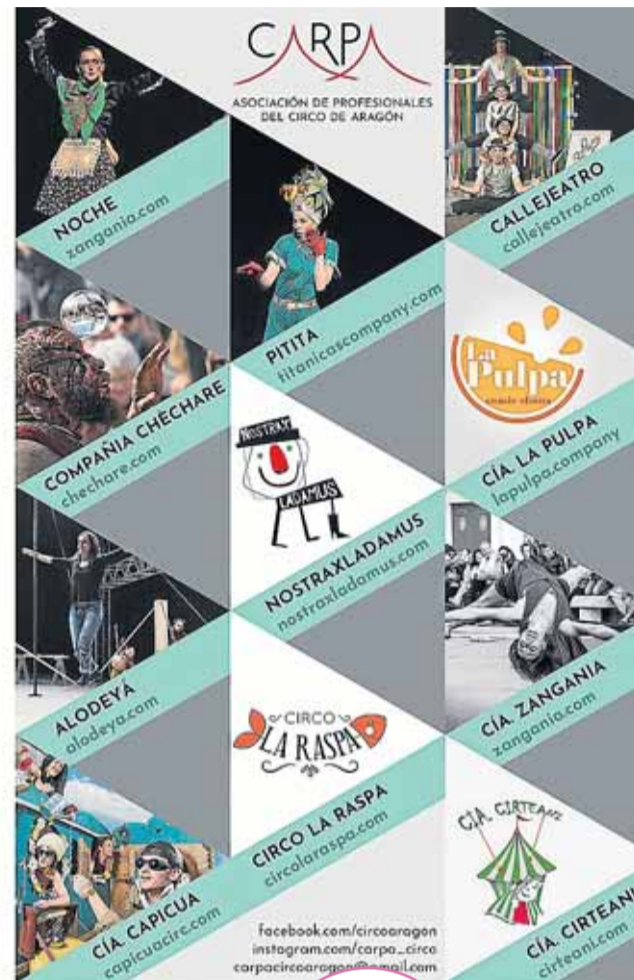
Carpa ofrece un folleto con los artistas que la forman.

La realización de estas acciones ha sido posible gracias a los fondos de los proyectos De Mar a Mar y el transfronterizo Poctefa. Sobre la gala que tendrá lugar esta tarde, avanzan que han intentado que haya “de todo un poco”. La forman seis números, pensados para todos los públicos. “La feria es un referente. En su denominación habla de teatro y de